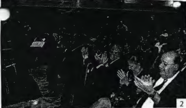
Homenaje a Alberto Cortez por 60 años de trayectoria musical.