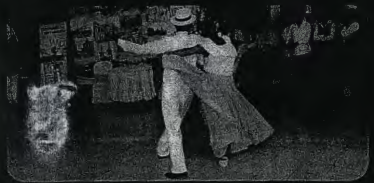
Baile tradicional guayaquileño interpretado por el grupo de teatro "Alma Ecuatoriana".